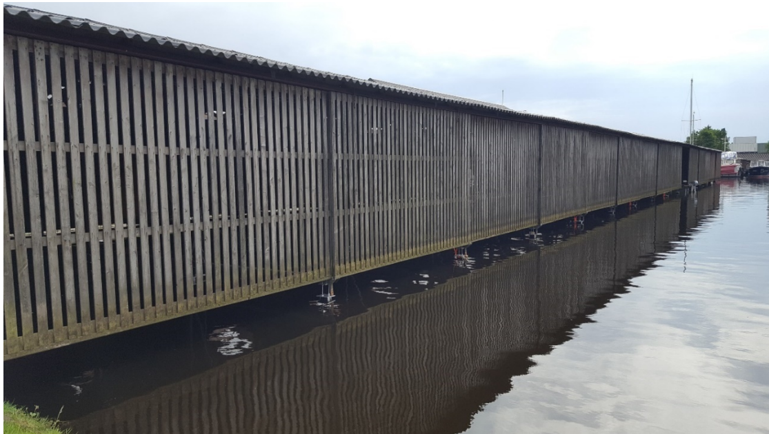
Afbeelding 1 Opgevijseld boothuis De Dobbe

De claim van De Dobbe ten aanzien van de functionele schade aan haar boothuizen is afgerond. De boothuizen zijn met 23 cm opgehoogd, de functie van de oevervoorzieningen en de toegang naar de boothuizen zijn hersteld.